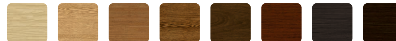
Дуб нордик Дуб натуральный Миланский орех Дуб коньяк Итальянский орех Темный орех Дуб графит Венге