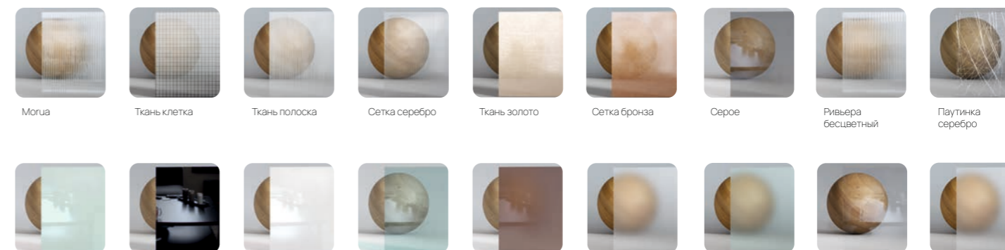
Мориа Ткань клетка Ткань полоска Сетка серебро Ткань золото Сетка бронза Серое Ривьера бесцветный Паутинка серебро Белый Черный Бесцветный просветлённый Прозрачное Сатин бронза Сатин белый Сатин белый Прозрачное просветлённое Сатин белый просветлённый